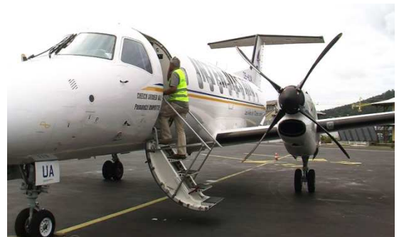
L'Ambrer 125 s'est écrasé au large de Moroni