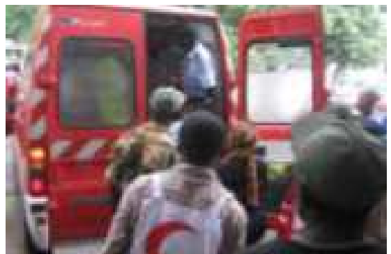
Les volontaires du CRCo accompagnent les rescapés à l'hôpital El Marouf.