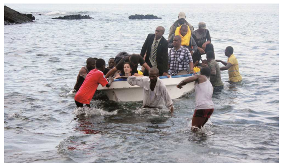
Les passagers ont rejoint le rivage aidés par les pêcheurs.